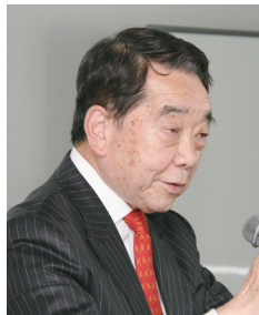
講師 KICCC(国際臨床保育研究所) 所長